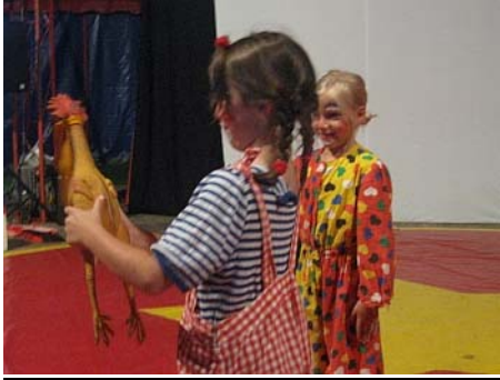
Die lustigen Clowns