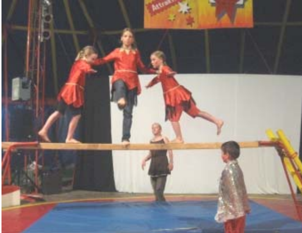
In schwebender Höhe: Kunststücke der Artisten des Zirkus Pumpernudl