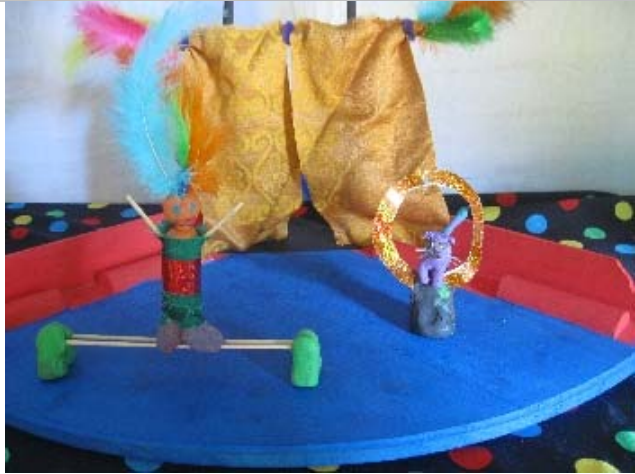
Zirkus Megabyte Trickfilme