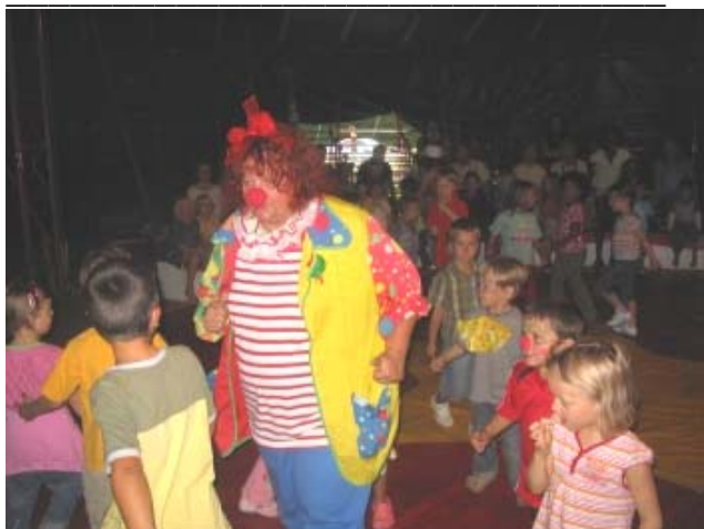
und die dumme Augustine.