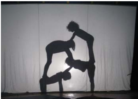
Und hier der wunderschöne Zirkus SHADOW